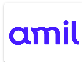
Tabela de Valores | COM Odonto

Amil Linha Seleccionada - Supermed - ABBPOL